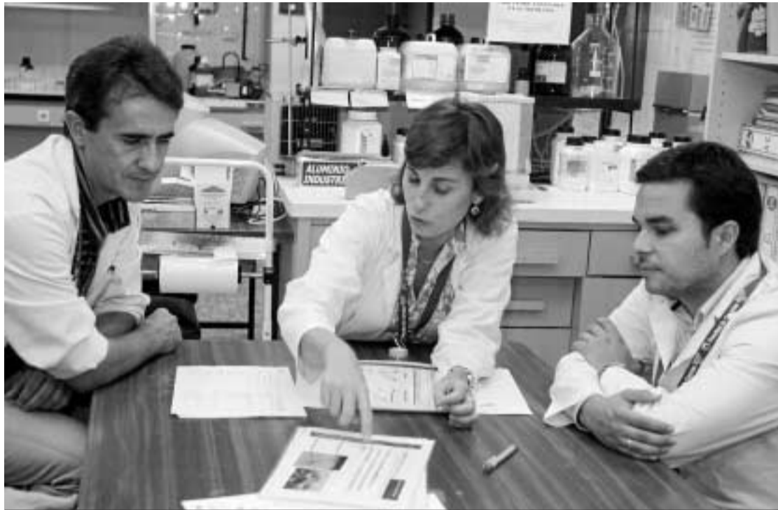
Un momento de la edición del año pasado de la Noche de los Investigadores.

Tienen, tenemos, varias razones. La más inmediata, seguro que ya lo pensaron, es la grave crisis económica en que vivimos y que se