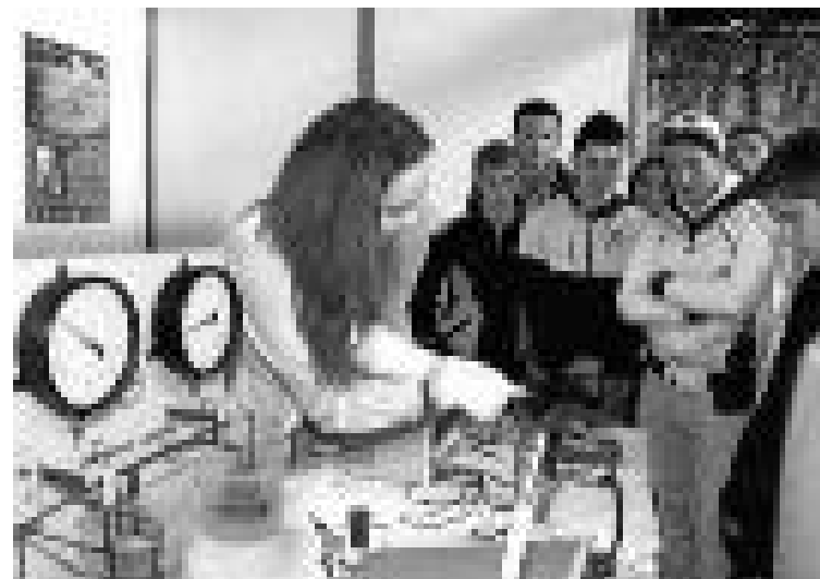
Demostración de cómo funciona una válvula ante estudiantes en una edición anterior de la Semana de la Ciencia.

cándola a la vida cotidiana. No hay nada como hacernos ver la cantidad de ciencia con la que convivimos para que nos demos cuenta de su cercanía y utilidad.