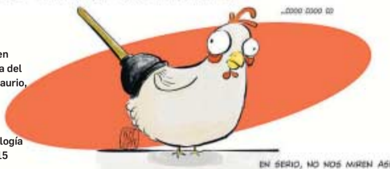
Imagen cómica del Pollosaurio, que ganó el Ig de Biología en 2015

pensando que todo ellos es algo fruto de “frikis” y descerebrados. Realmente no. Al premio acuden científicos de prestigio e incluso ganadores de los Nobel (los de la Academia de Suecia) para hacer entrega de los galardones (no hay premio en metálico real, ni nada parecido), quienes reconocen el valor de trabajos (publicaciones) que pueden parecer algo simples o inútiles pero que pueden aportar valor y quién sabe si descubrimientos de alcance. Es un reconocimiento a la investigación de base, no aplicada, pura, al deseo de conocer por conocer que impulsa a la ciencia.