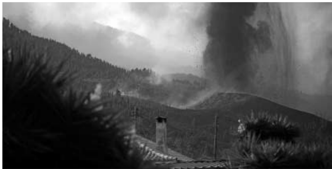
Una casa con el amenazante volcán al fondo.

El año pasado hubieron 68 volcanes que entraron en erupción, en este año el número confirmado es de 69; si hacemos historia hay 560 erupciones confirmadas por datos registrados en documentos escritos de la humanidad. De esas erupciones "históricas" puesto que alguien estaba por allí y de algún modo nos lo ha contado, sin duda la más famosa es la del Vesubio en el verano del año 79. Tradicionalmente se le asignaba la fecha del 24 de agosto, aunque estudios recientes parece que la sitúan el 24 de octubre. ¿Le falló la memoria a Plinio el Joven al describir la erupción en sus cartas a Tácito escritas años después de la erupción? ¿Algún copista medieval trastocó la fecha en las copias de los manuscritos que nos han llegado?